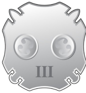
სამკერდე ნიშნის წინა მხარე