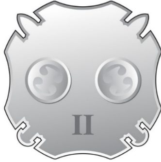
სამკერდე ნიშნის წინა მხარე