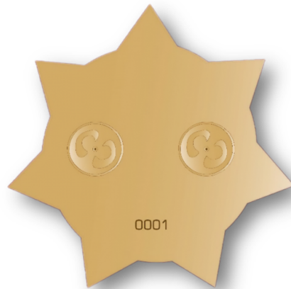
სამკერდე ნიშნის უკანა მხარე