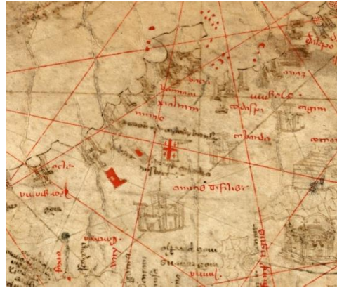
დომენიკო და ფრანჩესკო პიციგანების პორტოლანი