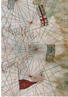
პიეტრო ვესკონტეს პორტოლანი